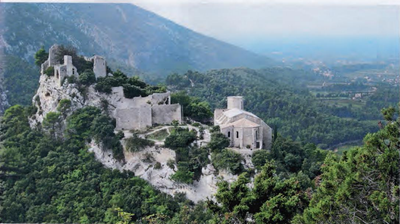
Oppède-le-Vieux est un magnifique petit village vauclusien.