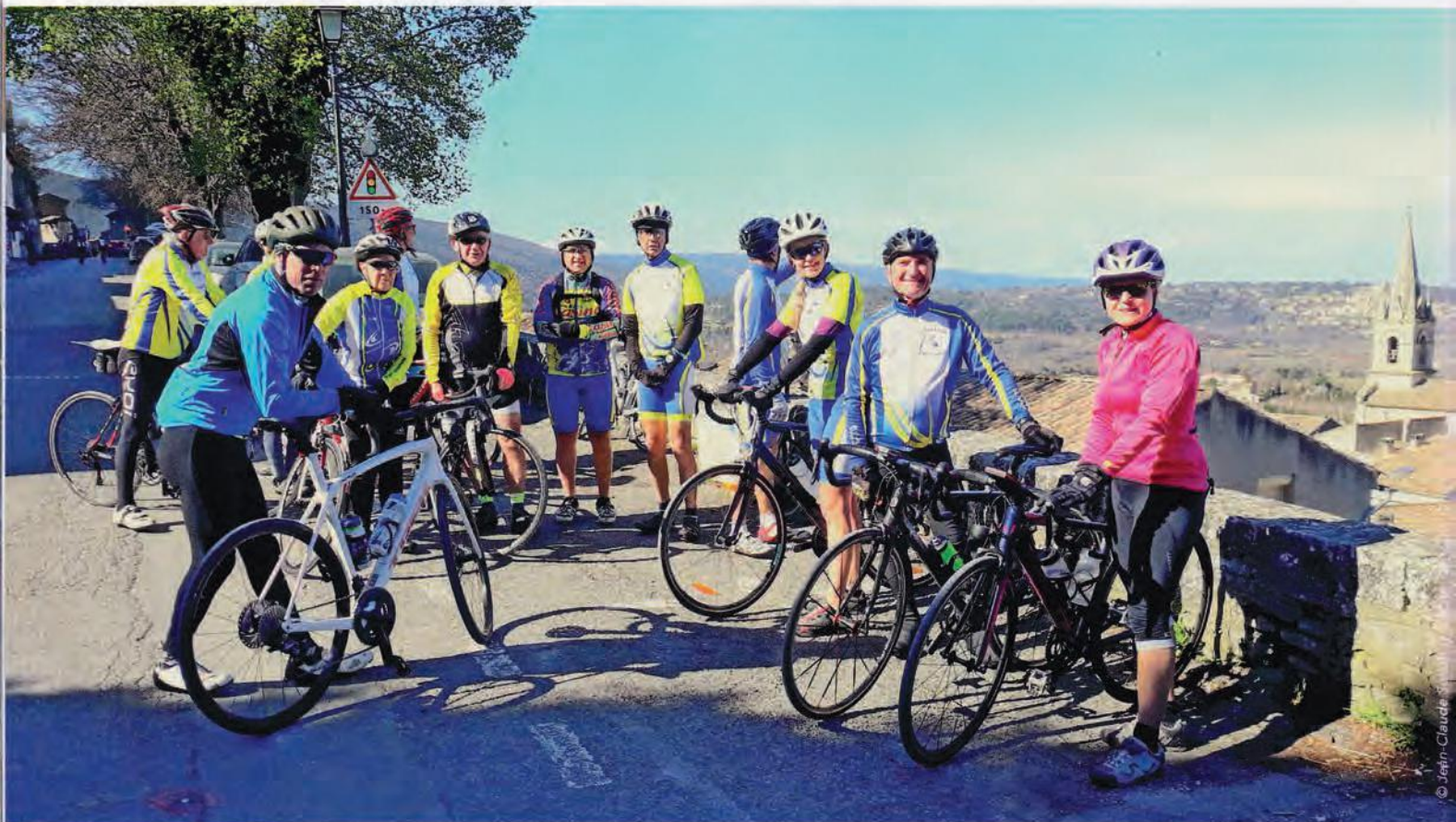
Photo souvenir sous le soleil.